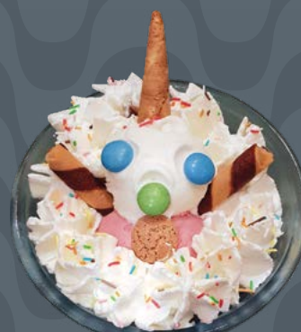
PINOCCHIO € 6,50

Gelato alla banana e fior di latte, banana, panna montata, salsa al cioccolato Banane und Milch Eis, Banane, Schlagsahne, Schokoladensauce Banana and milk icecream, banana, whipped cream, chocolate sauce