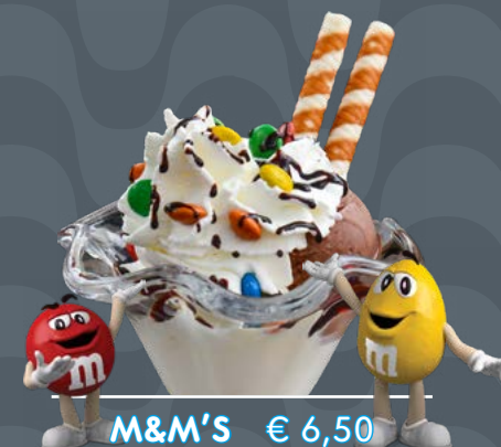
M&M'S € 6,50

Gelato alla vaniglia, salsa di fragole, scaglie di cioccolato bianco Vanillecreme Eis, Erdbeersauce, Weiße Schokostückchen Vanilla icecream, strawberries sauce, white chocolate flakes