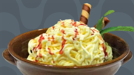
SPAGHETTI EIS € 6,50

3 Palline, gusti assortiti 3 Eiskugeln, verschiedene Geschmacksrichtungen Ice cream scoops, assorted flavors