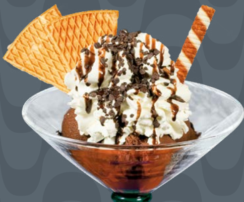
AFRICA € 8,00

Gelato al cioccolato e nocciola, panna montata, salsa al cioccolato, granella di nocciole Schokolade und Haselnuss-Eis, Schlagsahne, Schokoladensauce, gehackte Haselnüsse Chocolate and Hazelnut ice cream, whipped cream, chocolate sauce, fine chopped hazelnuts