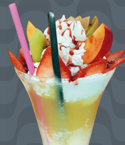
MANGIA E BEVI € 11,00

Gelato alla frutta, frutta fresca, panna montata Früchte Eis, Frischobst, Schlagsahne Fruit icecream, fresh fruit, whipped cream