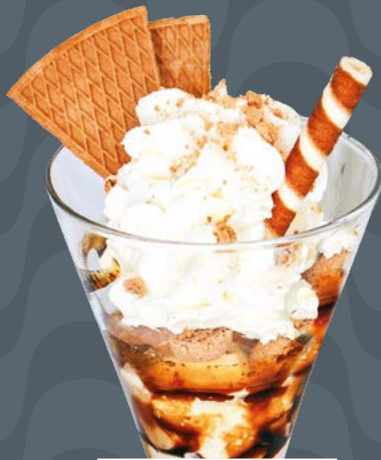
AMARETTO € 8,50

Gelato al cioccolato e nocciola, panna montata, salsa al cioccolato, granella di nocciole Schokolade und Haselnuss-Eis, Schlagsahne, Schokoladensauce, gehackte Haselnüsse Chocolate and Hazelnut ice cream, whipped cream, chocolate sauce, fine chopped hazelnuts