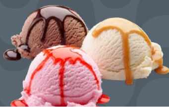
DEGUSTAZIONE € 6,00 CON PANNA + € 1,00

3 Palline, gusti assortiti 3 Eiskugeln, verschiedene Geschmacksrichtungen Ice cream scoops, assorted flavors