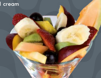
MACEDONIA € 6,50

Gelato alla fragole e fior di latte, panna montata, salsa alle fragole Erdbeere und Milch Eis, Schlagsahne, Erbeersauce Strawberries and milk icecream, whipped cream, strawberries sauce