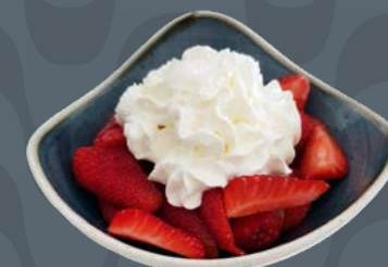
FRAGOLE con PANNA € 6,50

Gelato alle creme, panna montata, M&M's Vanillecreme Eis, Schlagsahne, M&M's Vanilla icecream, whipped cream, M&M's