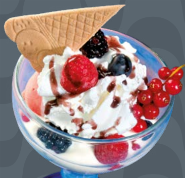
COPPA YOGURT € 8,50

Gelato alla frutta, frutta fresca, succo ananas, panna montata, salsa alle fragole Früchte Eis, Frischobst, Ananassaft, Schlagsahne, Erdbeersauce Fruit icecream, fresh fruit, pineapple juice, whipped cream, strawberries sauce