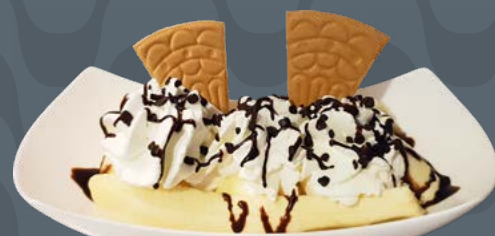
BANANA SPLIT € 8,00

Gelato con yogurt bianco e ai frutti di bosco, panna montata, frutti di bosco Beeren und Naturjoghurt Eis, Schlagsahne, Beeren Wild berries and plain yogurt icecream, whipped cream, wild berries