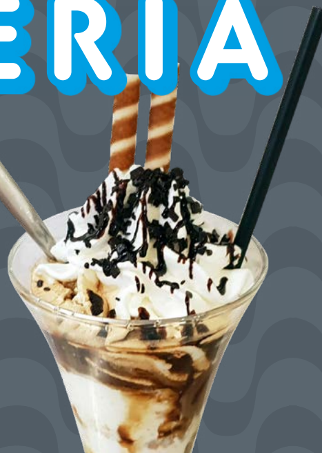
EIS KAFFE € 8,00

Gelato alle creme, panna montata, liquore Amaretto, biscotti amaretti Vanillecreme Eis, Schlagsahne, Amaretto Likör, Amaretti Keksen Vanilla icecream, whipped cream, Amaretto liqueur, Amaretti biscuits