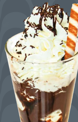
EIS SCHOKO € 8,00

Gelato alle creme, caffè freddo, panna montata Vanillecreme Eis, Kaffee, Schlagsahne Vanilla icecream, coffee, whipped cream