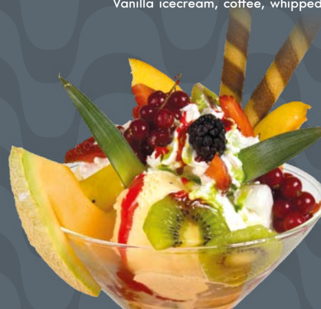
TROPICANA € 11,00

Gelato alle creme, panna montata, Baileys Vanillecreme Eis, Schlagsahne, Baileys Vanilla icecream, whipped cream, Baileys