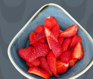
FRAGOLE € 5,50