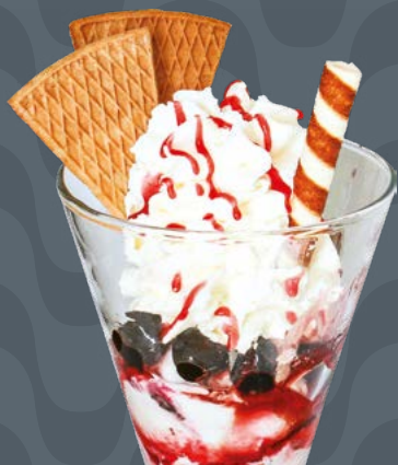
NAFTA € 8,50

Gelato alle creme, panna montata, cioccolato freddo Vanillecreme Eis, Schlagsahne, Schokolade Vanilla icecream, whipped cream, chocolate