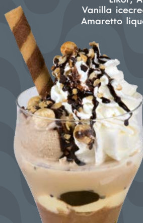
BAILEYS € 8,50

Gelato alla frutta, panna montata, amarene Früchte Eis, Schlagsahne, Sauerkirschen Fruit icecream, whipped cream, sour cherries