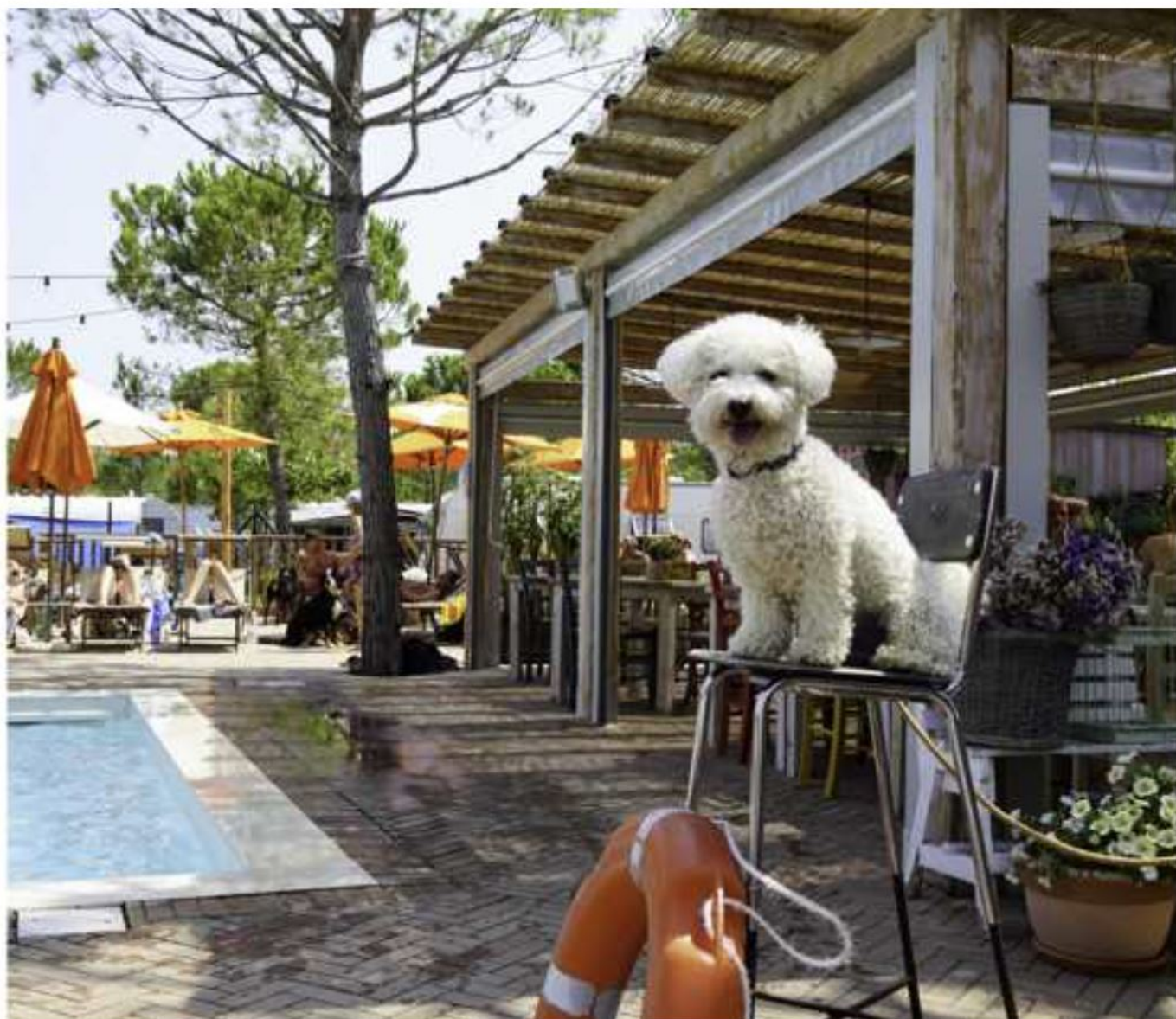
Una delle piscine dedicate ai cani all'interno del camping Union Lido di Cavallino Treporti

CAVALLINO TREPORTI - Le spiagge ampie, la spiaggia fine, il mare che si abbassa gradualmente. La costa adriatica si adatta facilmente alle esigenze di cani e padroni e qui sono nate strutture pensate ad hoc. Due esempi. In Veneto, a Cavallino-Treporti, c'è il DogCamp all'interno del camping 5 stelle Union Lido ( unionlido.com ): oltre 150 piazzole con servizi dedicati per chi arriva in camper, tenda, roulotte; 44 case mobili che ospitano famiglie insieme al loro cane; una spiaggia di 1.000 metri quadrati con ingresso dedicato; 3 piscine; un'area agility dog con istruttori e veterinario. In spiaggia i cani sono liberi di entrare in acqua, giocare, riposare sulla spiaggia o nella pineta per poi tornare ripulirsi alla tolettatura self-service con doccia, asciugatore e aspiratore. Numerosi i ristoranti dog-friendly del camping, ma per chi desidera una cena più intima o vuole utilizzare la spa, c'è la possibilità di affidarsi al servizio di dog-sitting (10 euro/ora). L'intera struttura è composta da piazzole, case mobili e glamping e ha due parchi acquatici - di cui uno con sabbia cristallina -, numerosi ristoranti (carne, pesce, fusion, burgeria,...) e un'ampia spiaggia libera.